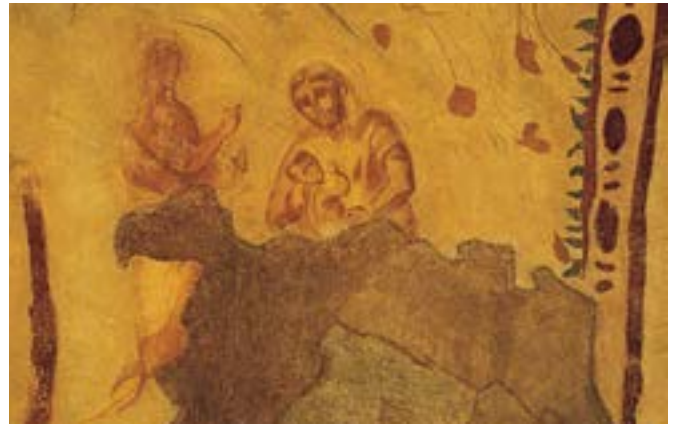
imagen de Cristo.

una iconografía auténticamente bizantinas. La importancia de la Virgen en el pensamiento cristiano había ido en aumento desde la celebración del III Concilio Ecuménico de Éfeso en el 431, en el que, tanto la Iglesia Católica, especialmente el Oriente cristiano y la iglesia Copta, le concedieron tanta relevancia como hubiere tenido hasta el momento la